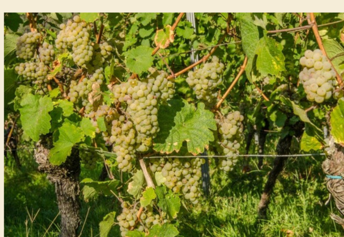
Die Trauben konnten in letzter Zeit noch viel Sonne tanken!