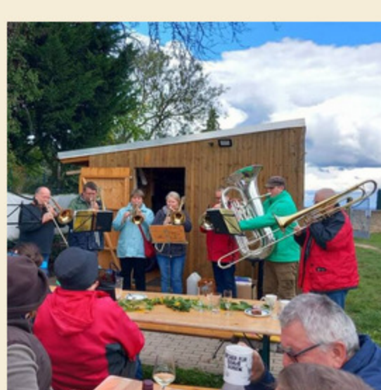
Mehr Bilder gibt es bald auf unseren Social Media Kanälen...